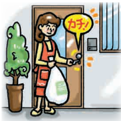
■ ゴミ出しでも鍵かけを習慣に