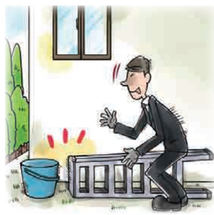
■ 足場となる物を片付ける