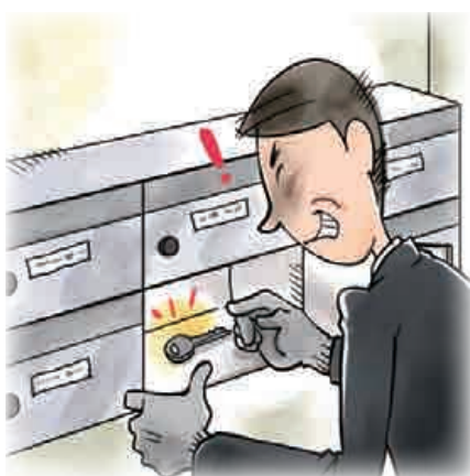
■ 合鍵を家の外に置かない