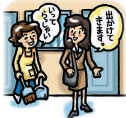
■ 外出する時は声をかけ合う