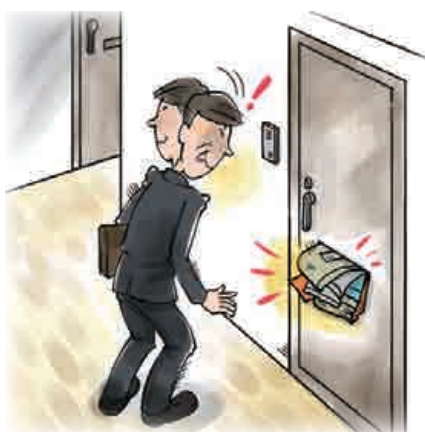
■ 新聞や郵便物をためない