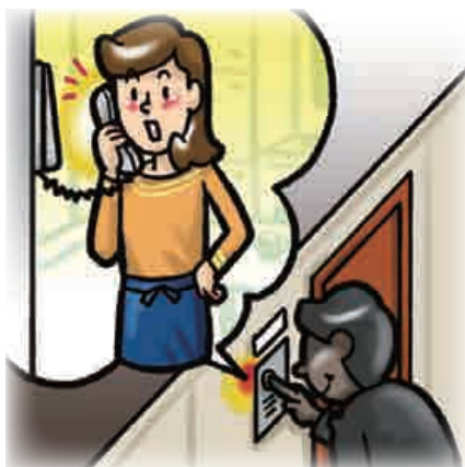
■ 訪問者を確認するまでドアを開けない