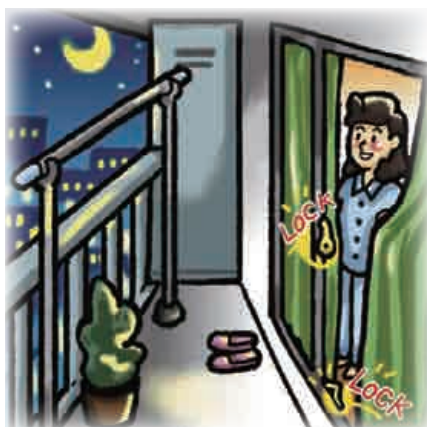
■ 高層階でも就寝時には窓に施錠