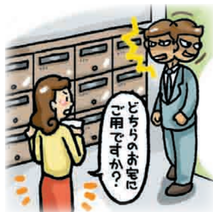
■ 見慣れない人には一声かける