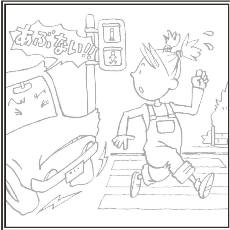
しんごうは ぜったい まもろう