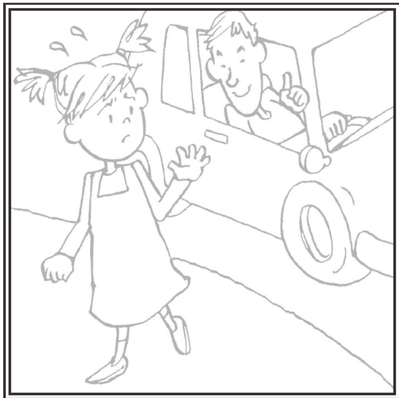
知らないひとの くるまにのらない