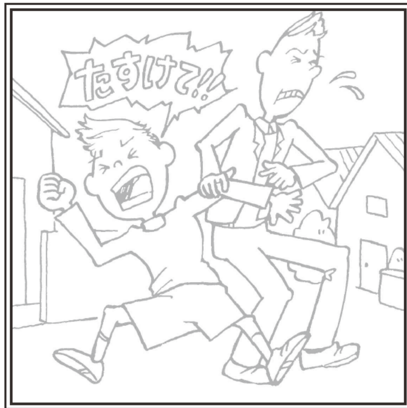
こわいときは「たすけて!」と おおごえをだす